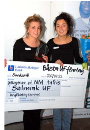
Tjejerna i Salmiak UF vann bästa UF-företag både på regional och nationell nivå.

Entreprenör Y har under projekttiden stöttat Ung Företagsamhet med sin spridning genom att bekosta en del material samt genom att vara samarrangör vid lokala och regionala e-dagar. Under projekttiden har ungdomar kopplade till den regionala UF-föreningen bland annat fått utmärkelserna Årets Anders Wall stipendiat samt Årets UF-företag (Salmiak UF – bild till vänster) vilket är ett gott betyg till den regionala verksamheten.