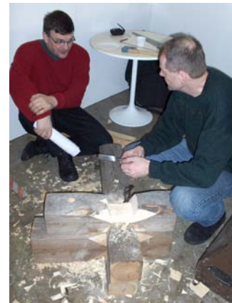
Lärare i samspråk kring timmerprojektet i Minervaskolans monter på mässan Våga Vara Egen.