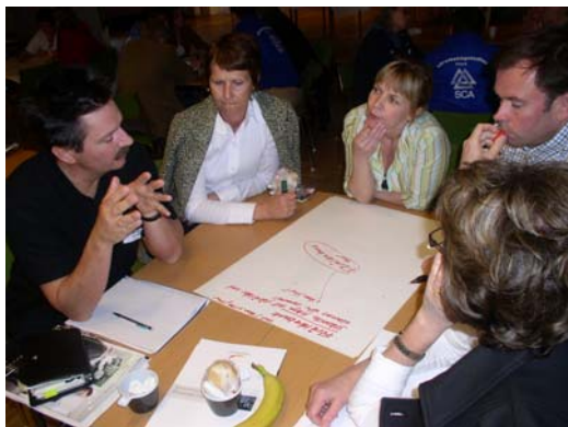
Lärare från Höglundaskolan under workshop på Gränslöst.

Det vi kan konstatera är att det finns ett stort intresse för dessa frågor och ett stort behov av stöd i form av nätverk, verktyg och inspiration. Vi hoppas att sådana insatser kan genomföras i kommande verksamhetsperiod.