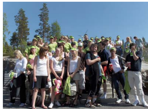
Ungdomar som deltog på den regionala kickoffen för Sommarlovsentreprenörer i juni 2006.