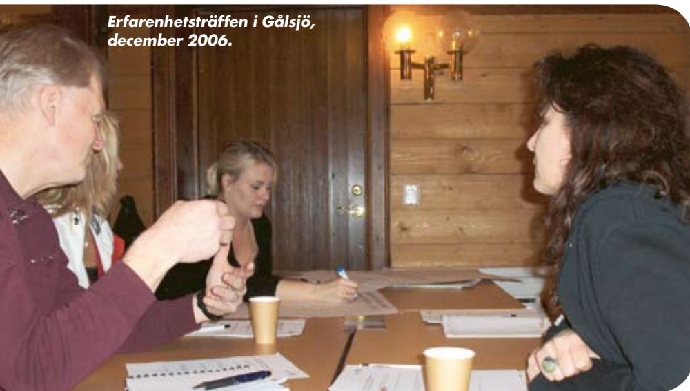
Erfarenhetsträffen i Gålsjö, december 2006.