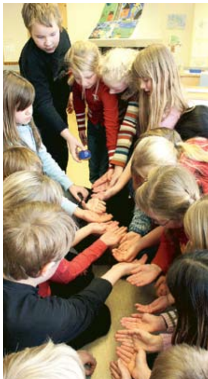
Klassen fick jobba med olika samarbetsövningar.